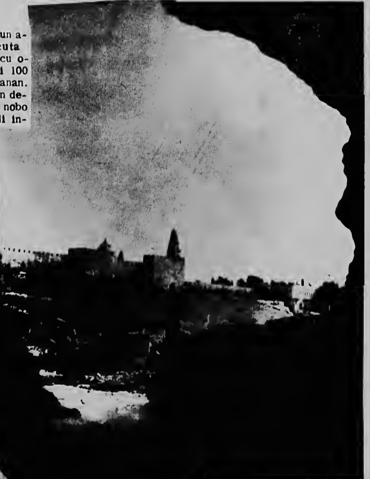
Esaki ta un bista di e seru Sion un di e puntonan cu Papa Pablo lo bishita na Januari venidero durante su estadia na Israel. Papa Pablo lo ta e prome Papa cu ta bishita e Terra Santu desde cu San Pedro a sali pa Roma.